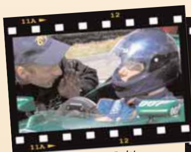
Några sista goda råd, sen är det bara du och F1:an...

Ett medlemskap i SMS Challenge Executive club är inte bara en ingång i sporten för svenska företag. Medlemmarna får själva prova på både att köra riktiga tävlingsbilar och att åka med våra landslagsförare.